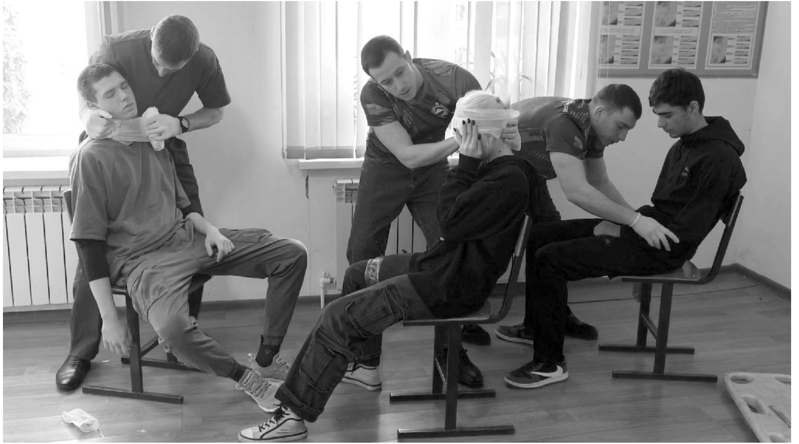
Участники подготовили видеоролик, в котором оказывают доврачебную помощь пострадавшим с различными видами травм

Состязания включали в себя три задания. Команда в режиме видео-