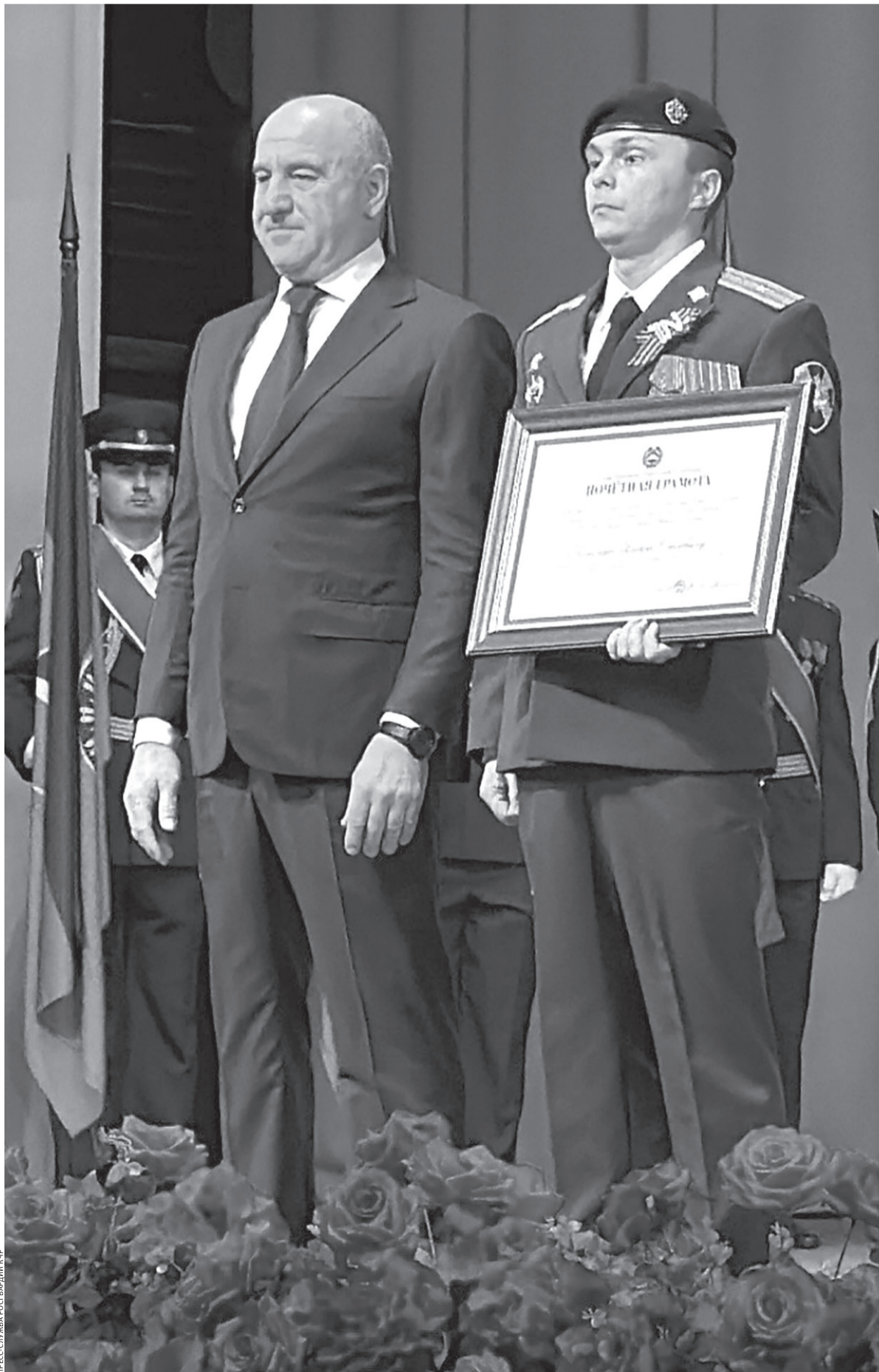
Рашид Темрезов вручил награды отличившимся росгвардейцам