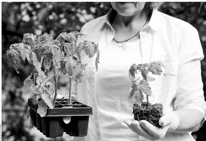
Рассаду необходимо постепенно приучать к перепадам температур

Подготовила ЛАРИСА НИКОЛАЕВА (по информации сайта «Антонов сад»).